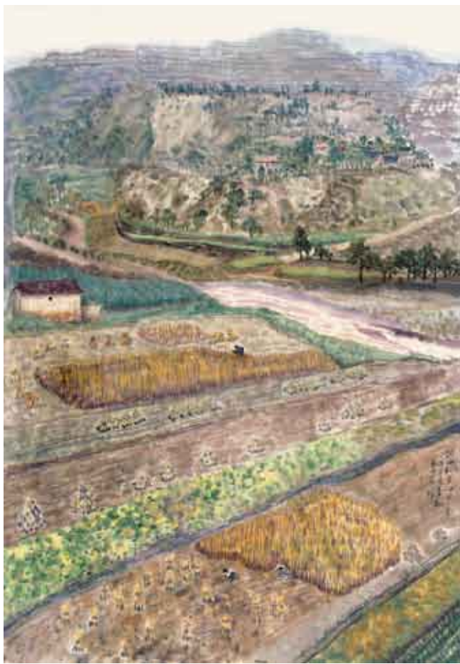
山村奇彩无俗路，川垄生金有余香——陇西和平乡写生 186厘米×120厘米 纸本 2010年 李翔