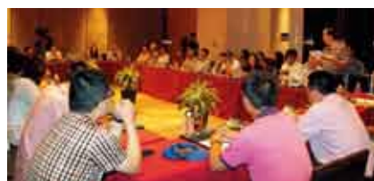
省内外企业家座谈会现场