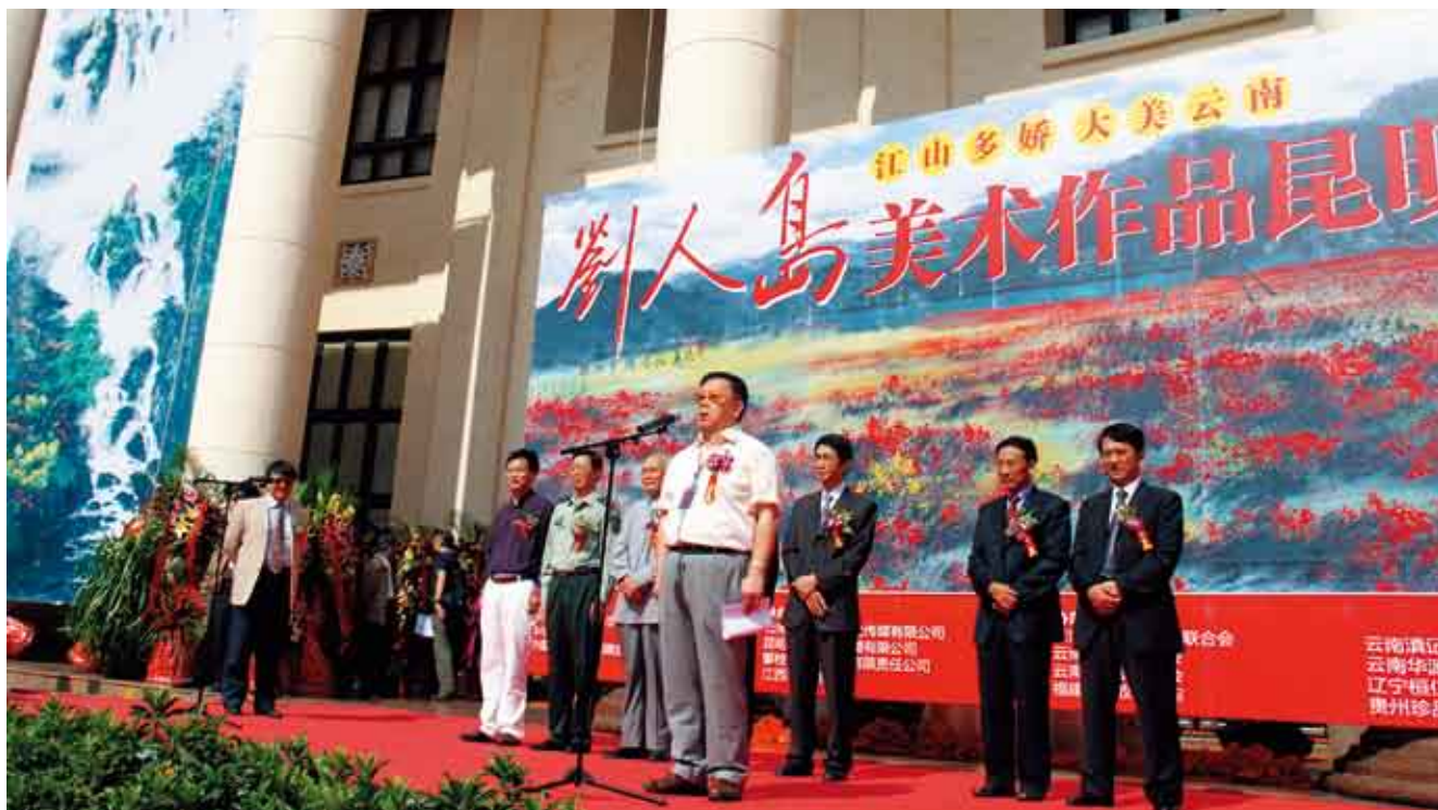
刘人岛美术作品昆明展开幕现场瞿琮将军发言