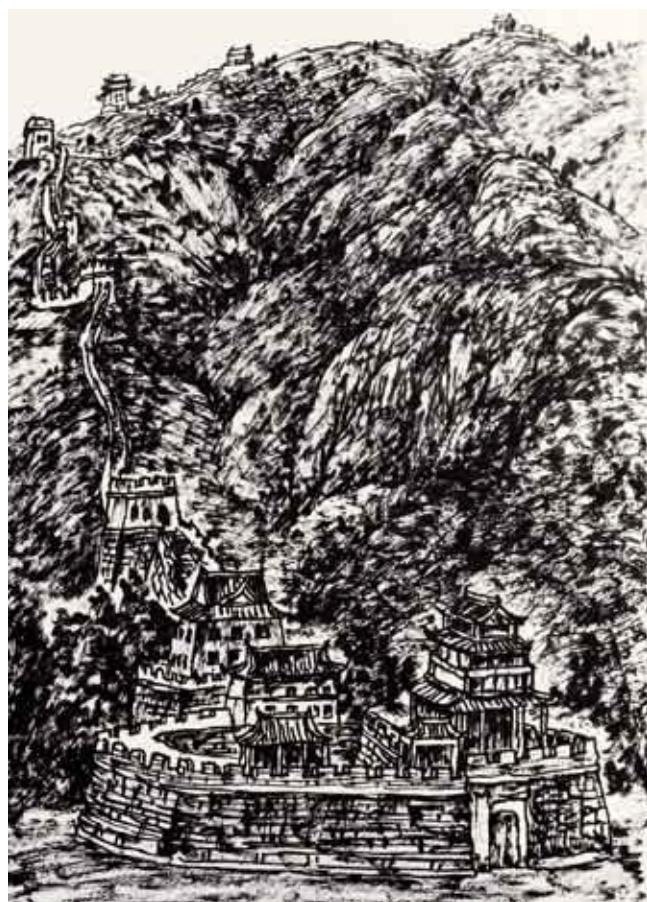
苍茫天地间 28.5厘米×21厘米 焦墨山水画 2010年 王界山