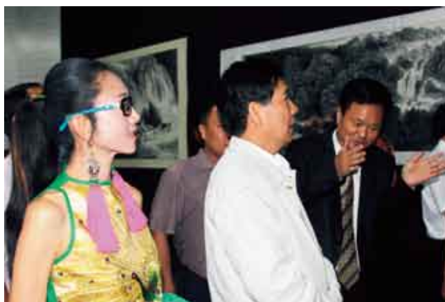
刘人岛在向中共云南省委秦光荣书记、中国著名舞蹈艺术家杨丽萍女士介绍本次展览的云南题材作品