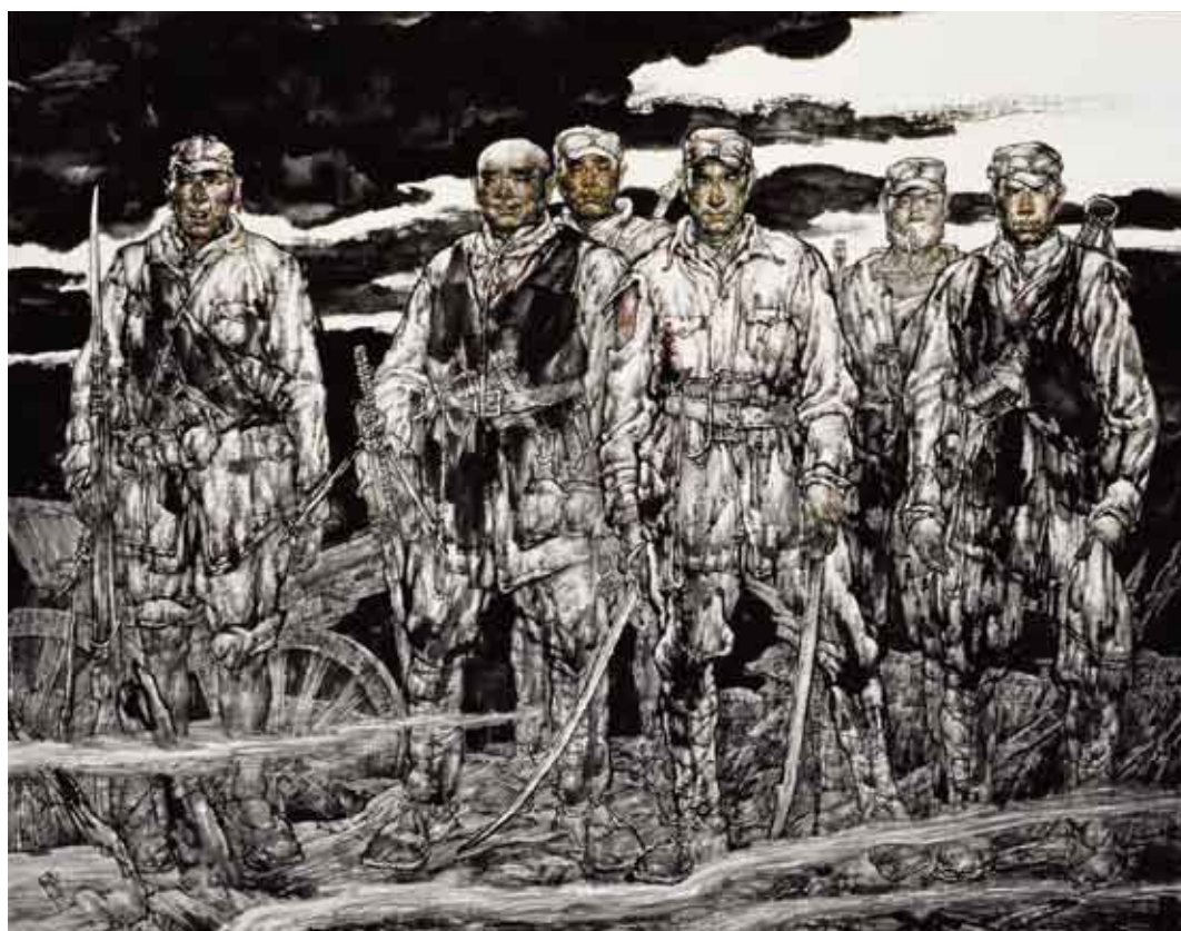
峥嵘岁月 220厘米×160厘米 王阔海