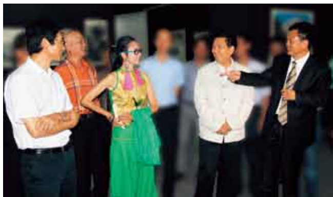
刘人岛在向中共云南省委秦光荣书记、中共云南省委宣传部赵金部长、中国著名舞蹈艺术家杨丽萍女士介绍本次展览的云南题材作品