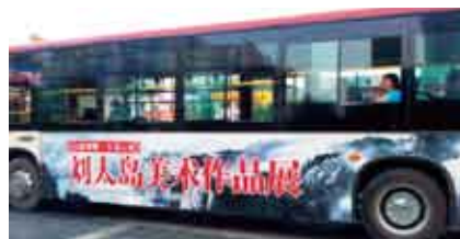
市区50辆公交车身广告宣传以及1000辆公交车LED屏广告宣传