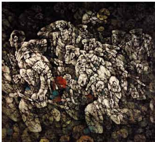
水兵日记 180厘米×180厘米 2004年二稿 周永家