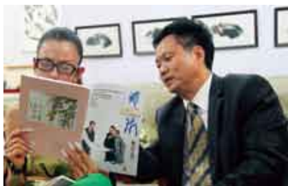
著名舞蹈家杨丽萍仔细阅读由刘人岛教授主编的《艺术》杂志