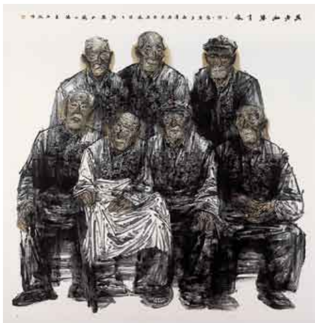
为老红军肖像 180厘米×190厘米 任惠中