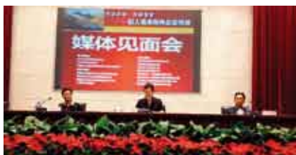
江山多娇·大美云南——刘人岛美术作品昆明展媒体见面会