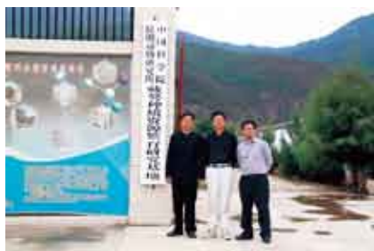
走进香格里拉中科藏墓基地

手法发挥得淋漓尽致，同时也将七彩云南的多姿、独特、神奇与美丽的自然风光以绘画艺术的表现形式向世界展现出来。