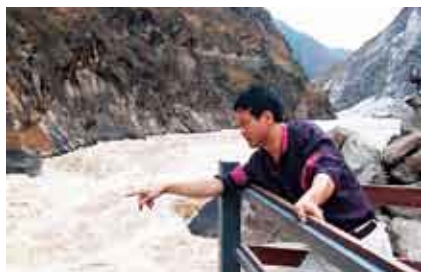
刘人岛近观虎跳峡口