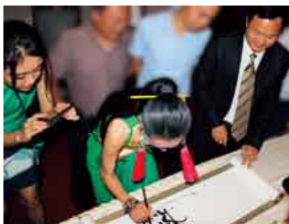
杨丽萍在展览贵宾簿上签上自己独特创意的大名