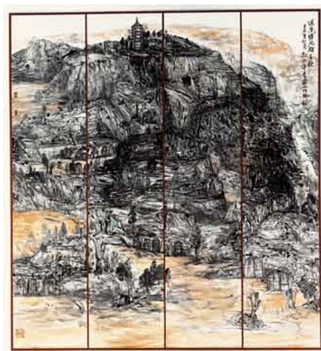
延安曙光耀千秋 250厘米×240厘米 郭兴华、闫禹铭、张亚芸、李霖