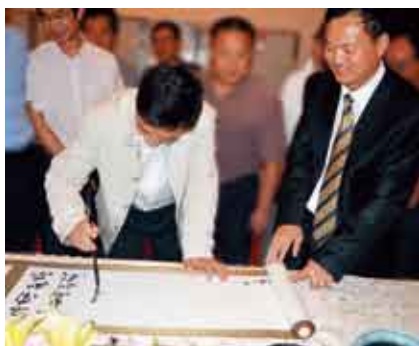
秦书记为展览亲笔题词