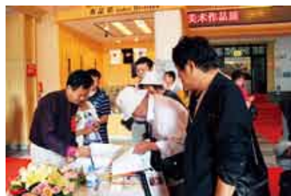
古稀老人在画展现场向刘人岛教授要签名画册留念