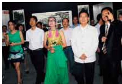
中共云南省委秦光荣书记在百忙之中也抽空前来观展，陪同的有中国著名舞蹈艺术家杨丽萍女士、中共云南省委宣传部赵金部长等领导。

本次展览是刘人岛首次在云南举办个人展，共展出刘人岛近年来创作的200余幅山水画精品，展出作品除了2005年被选入“神舟6号”带入太空的精品山水画作《浮云山霭莽苍苍》以外，还展出了以云南美景创作的国画精品佳作《永远的香格里拉》《金色丽江古城》《虎口石险滩作垫》《春溢石林》等55幅，展览期间还展出了刘人岛近年来的艺术专著6套共计800万字，学术论文300余篇，为本次展览学术氛围增色不少。本次展览展出作品从不同角度展现了祖国大好河山的壮美多姿。充分展现了大美云南的独特神韵和迷人魅力，对于进一步提升云南良好的对外形象将产生积极作用。